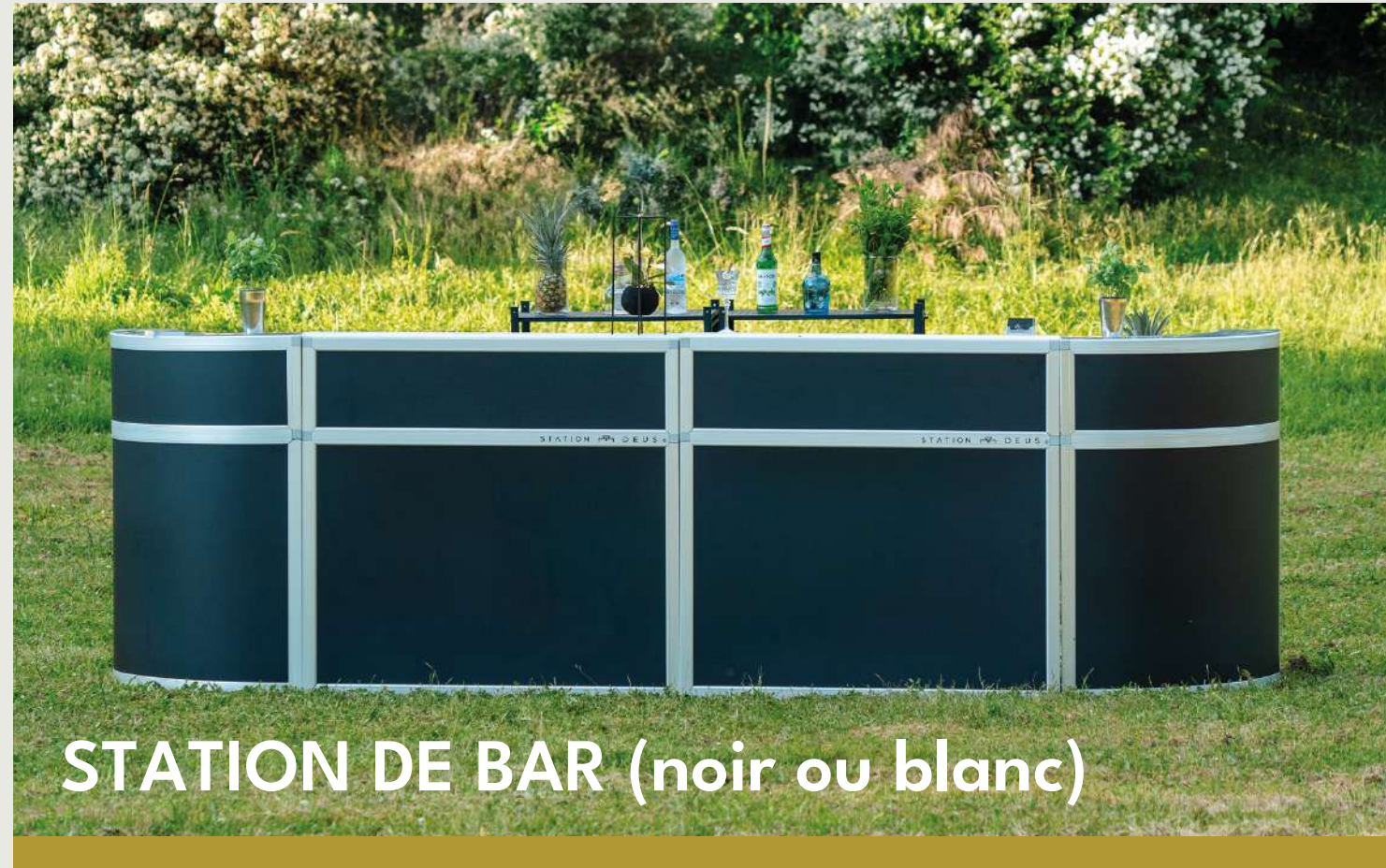
STATION DE BAR (noir ou blanc)